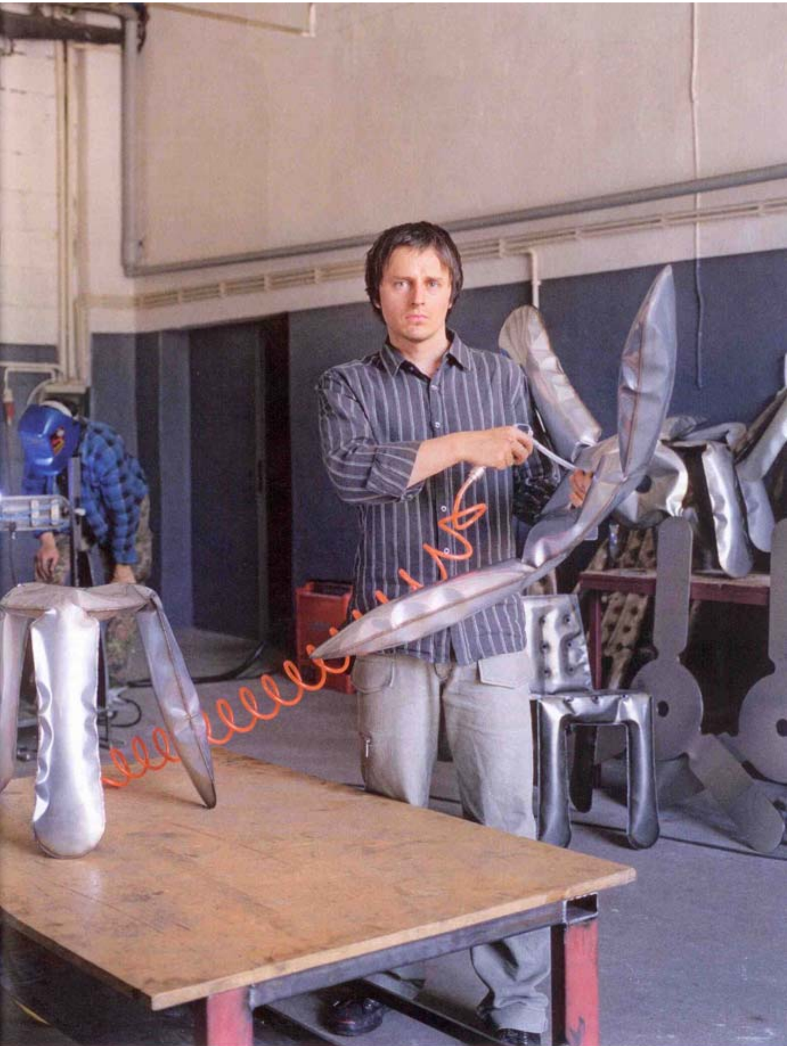
den Hocker aufbläst, schweißen ein Roboter und ein Assistent bereits die nächsten Bleche zusammen